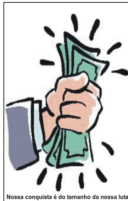
Nossa conquista é do tamanho da nossa luta

A Energisa, faz questão de propagar que investe na cultura, no desenvolvimento e capacitação dos trabalhadores, quando na prática tudo isso não passa de hipocrisia, já que não motiva nem incentiva aqueles que dão o sangue para que a empresa cresça. O que existe de fato é que a empresa massacra os